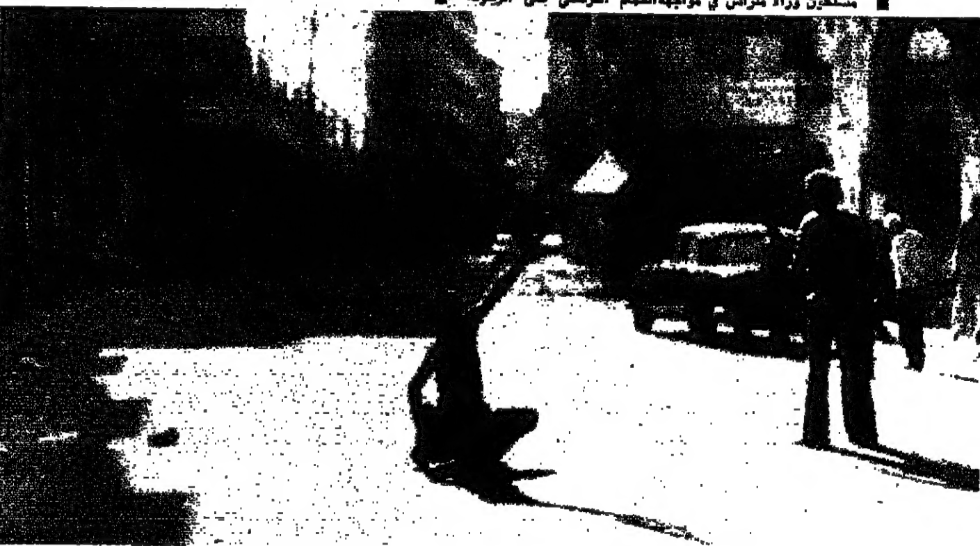
اطلاق الرصاص وسط الشارع